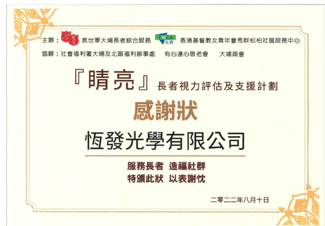
來自救世軍大埔長者綜合服務及香港基督教女青年會秀群松柏社區服務中心的感謝狀