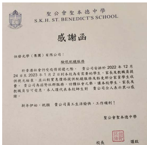
來自聖公會聖本德中學的感謝信