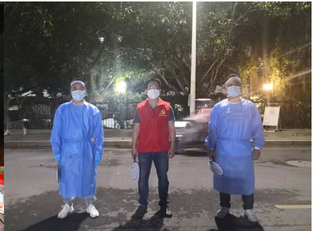
於當地COVID-19檢測及疫苗接種計劃中擔任志願者