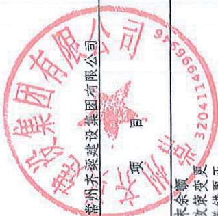
合并所有者权益变动表