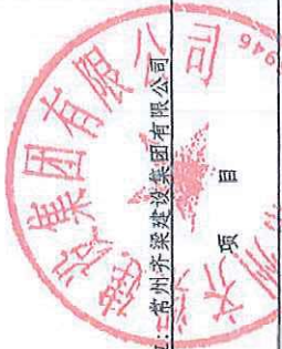
合并所有者权益变动表