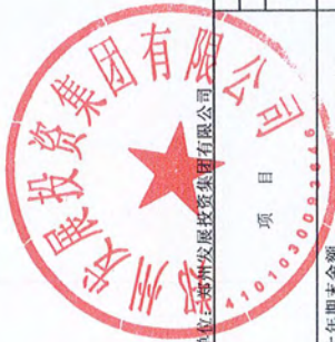
合并所有者权益变动表 2022年度