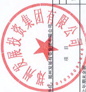
合并所有者权益变动表（续）