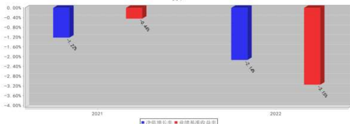
东方红锦和甄选18个月持有混合C基金每年净值增长率与同期业绩比较基准收益率的对比图（2022年12月31日）

注：1、基金的过往业绩不代表未来表现。 2、合同生效当年期间的相关数据和指标按实际存续期计算，不按整个自然年度进行折算。