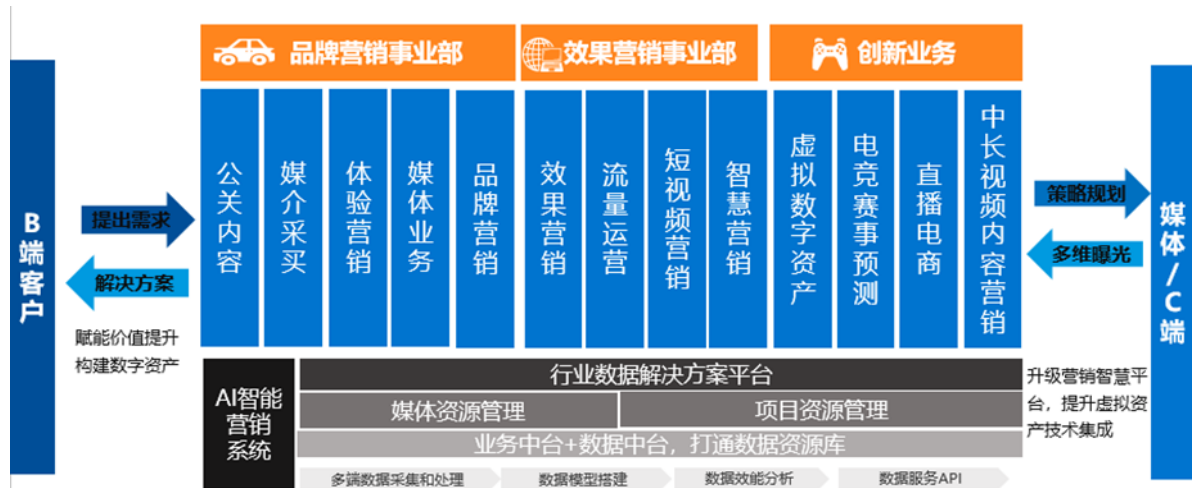
公司数字营销业务模式图

发行人的主营业务为数字营销，主要服务于汽车、互联网、游戏、金融、旅游、快速消费品等行业客户，提供一体化数字营销解决方案。发行人业务已覆盖公关营销、媒介采买、体验营销、品牌营销、效果营销、流量运营、短视频营销、智慧营销、虚拟数字资产、电竞赛事预测、直播电商、中长视频内容营销、直播电商等数字营销全链条。