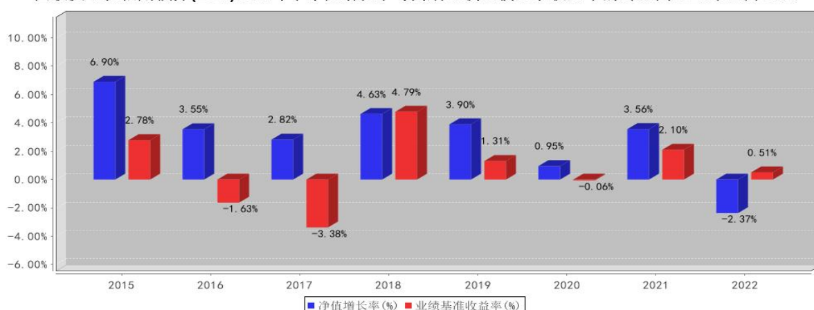
国联安双佳信用债券(LOF)基金每年净值增长率与同期业绩比较基准收益率的对比图2022年12月31日