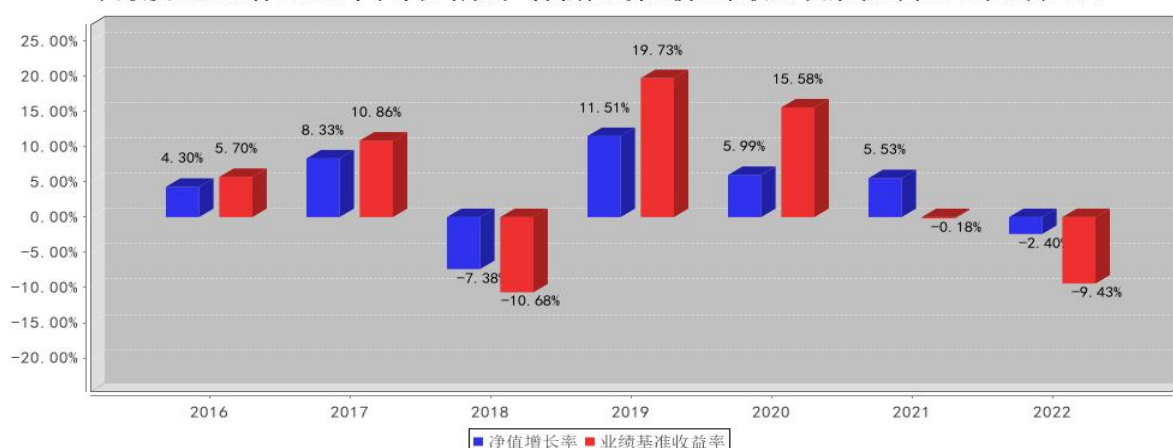
国联安通盈混合C基金每年净值增长率与同期业绩比较基准收益率的对比图2022年12月31日