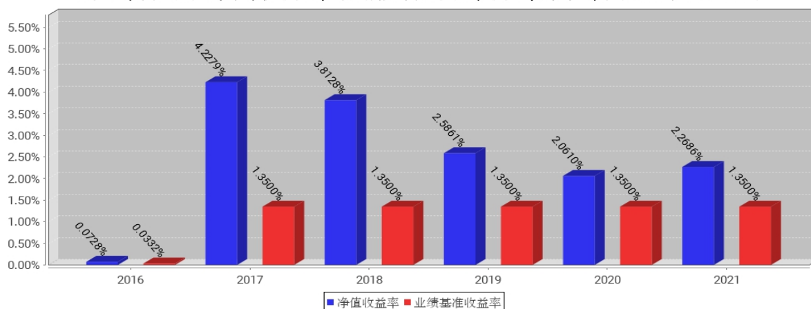
工银如意货币A基金每年净值收益率与同期业绩比较基准收益率的对比图（2021年12月31日）

注：1、本基金基金合同于2016年12月23日生效。合同生效当年不满完整自然年度的，按实际期限计算净值收益率。