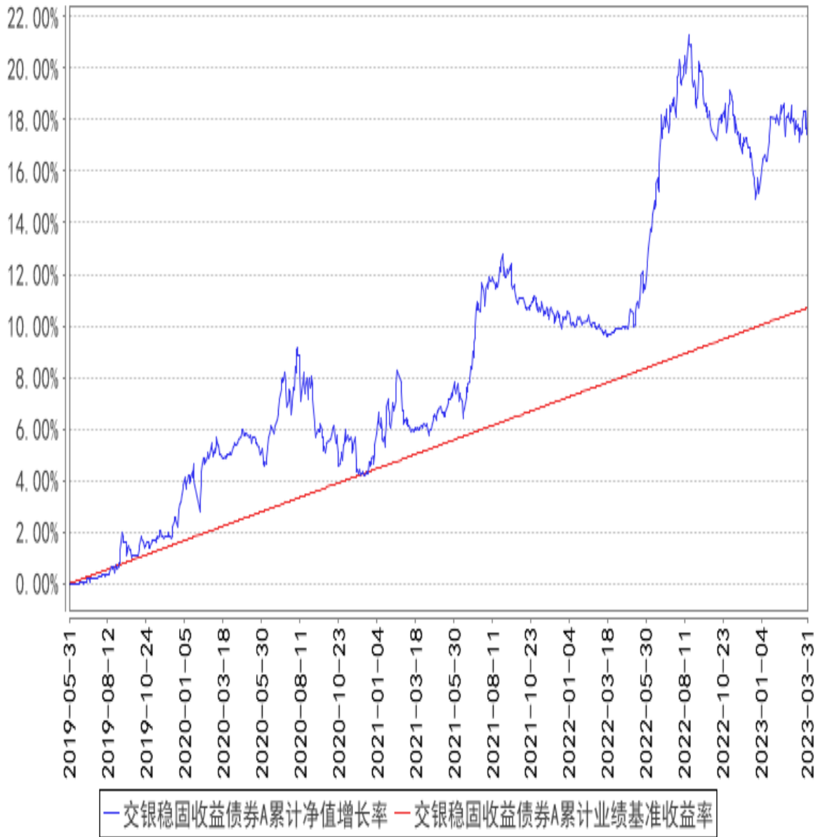
交银稳固收益债券A累计净值增长率与同期业绩比较基准收益率的历史走势对比图