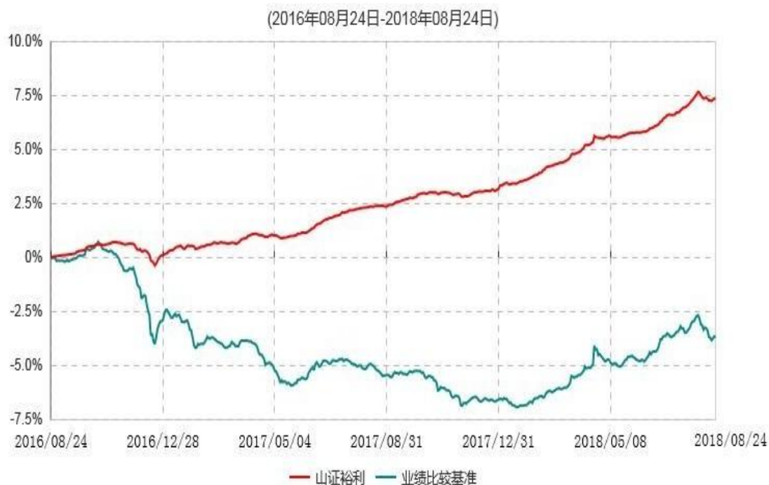
山西证券裕利债券型证券投资基金累计净值增长率与业绩比较基准收益率历史走势对比图

注：1. 按基金合同和招募说明书的约定，本基金自基金合同生效之日起6个月内使基金的投资组合比例符合基金合同的有关约定。