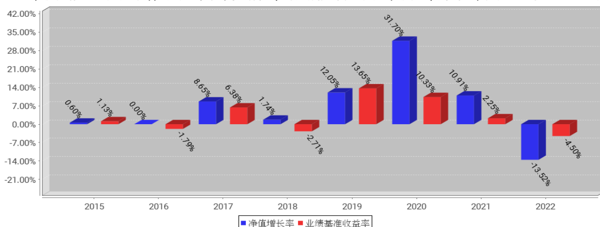
工银丰收回报灵活配置混合C基金每年净值增长率与同期业绩比较基准收益率的对比图（2022年12月31日）