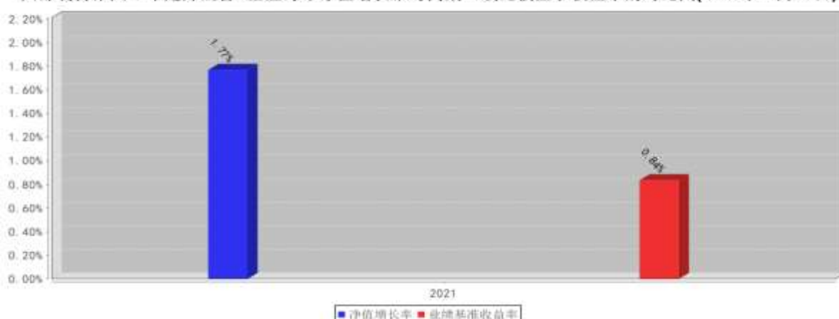
西部利得聚兴一年定开混合A基金每年净值增长率与同期业绩比较基准收益率的对比图(2021年12月31日)