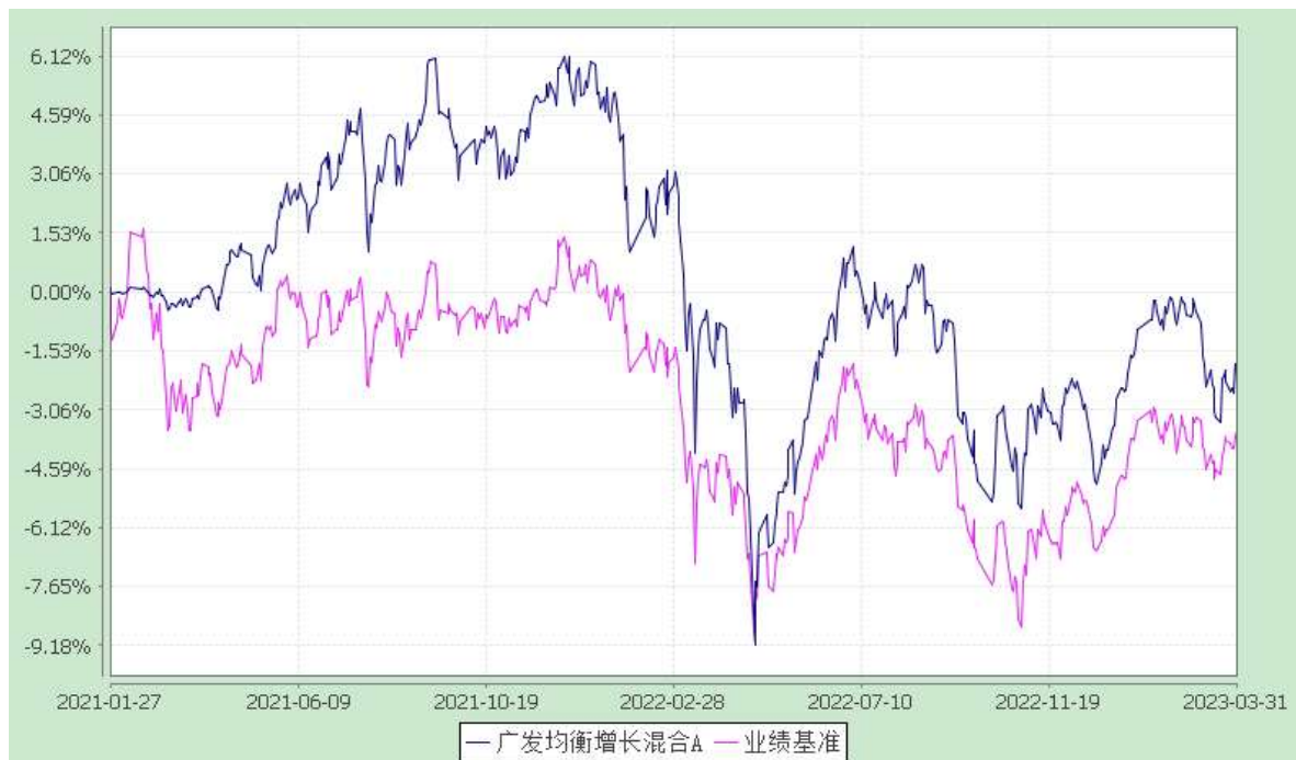
广发均衡增长混合 C: