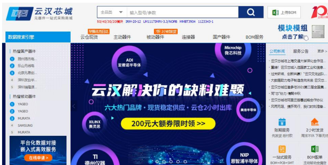
图：云汉芯城线上商城（www.ickey.cn）界面

长期以来，电子元器件领域上游原厂高度集中，下游电子产品制造企业则相对分散，上下游存在显著的信息不对称现象，整体产业链效率低下，上游厂商无法高效覆盖下游需求，而大量中小批量研发、生产、采购需求也难以获得优质的供应链服务，客户面临搜寻成本高、采购价格贵、假货多、服务差的困境。为破解行业痛点，通过对传统供应链进行全流程的数字化改造和集约化创新，公司打造了涵盖数据中台、技术中台、业务中台等在内完善的产业互联网技术架构，不断提升面向优质供应商和海量下游客户的技术服务能力。