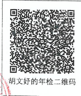
胡文好的年检二维码

本证书经检验合格，继续有效一年。 This certificate is valid for another year after this renewal.