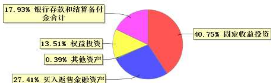
投资组合资产配置图表(2023年3月31日)

● 固定收益投资 ● 买入返售金融资产 ● 其他资产 ● 权益投资 ● 银行存款和结算备付金合计