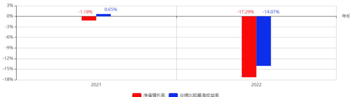
基金每年的净值增长率及与同期业绩比较基准的比较图