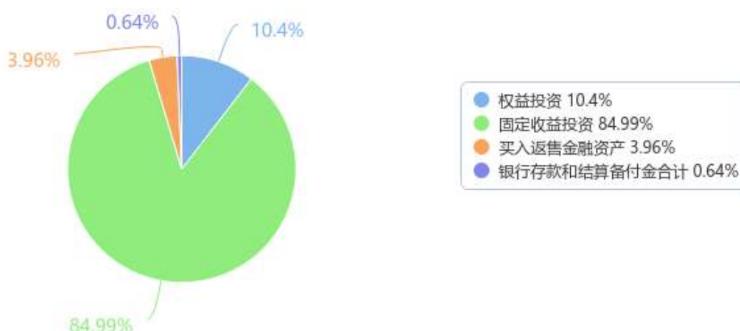
投资组合资产配置图表 (数据截至日期: 2023年03月31日)