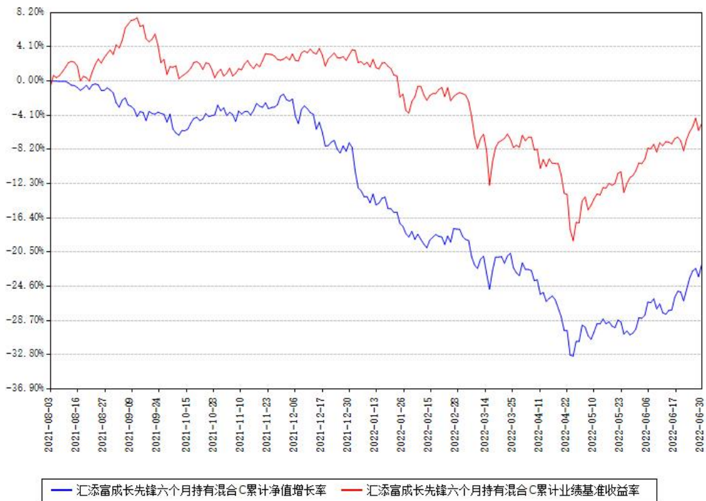
汇添富成长先锋六个月持有混合C累计净值增长率与同期业绩基准收益率对比图