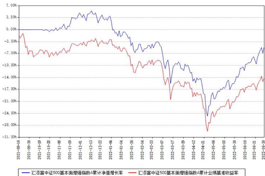
汇添富中证500基本面增强指数A累计净值增长率与同期业绩基准收益率对比图