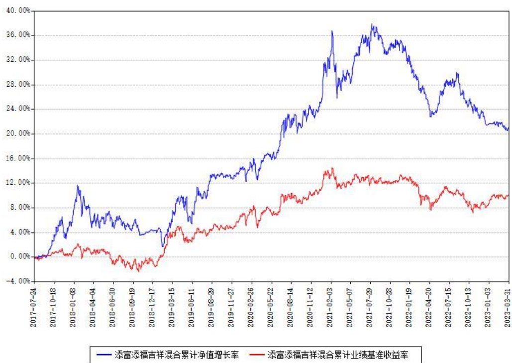
添富添福吉祥混合累计净值增长率与同期业绩基准收益率对比图