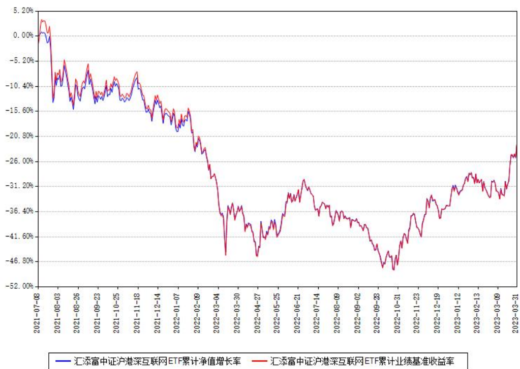
汇添富中证沪港深互联网ETF累计净值增长率与同期业绩基准收益率对比图