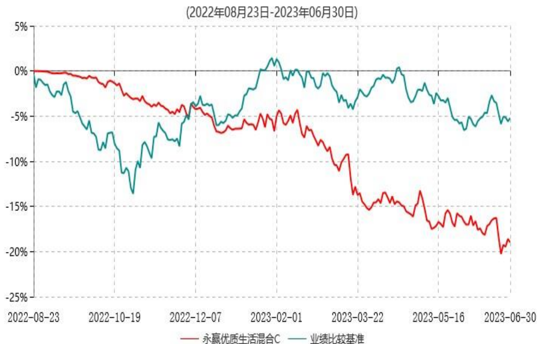
永赢优质生活混合C累计净值增长率与业绩比较基准收益率历史走势对比图

注：1、本基金合同生效日为 2022 年 8 月 23 日，截至本报告期末本基金合同生效未满足一年；