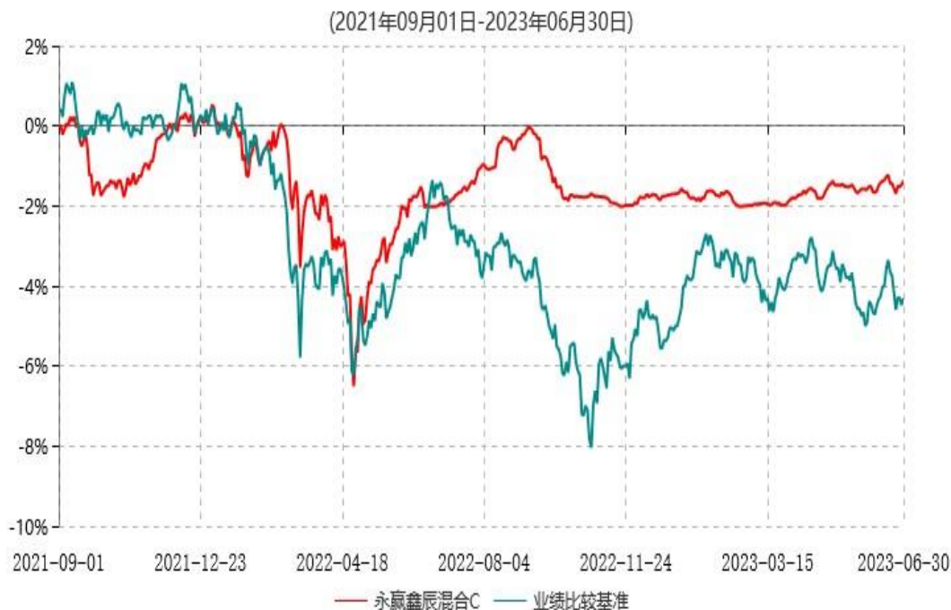
永赢鑫辰混合C累计净值增长率与业绩比较基准收益率历史走势对比图