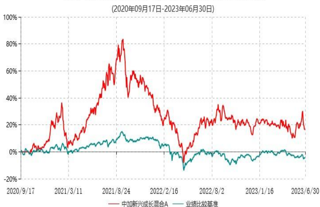
中加新兴成长混合A累计净值增长率与业绩比较基准收益率历史走势对比图