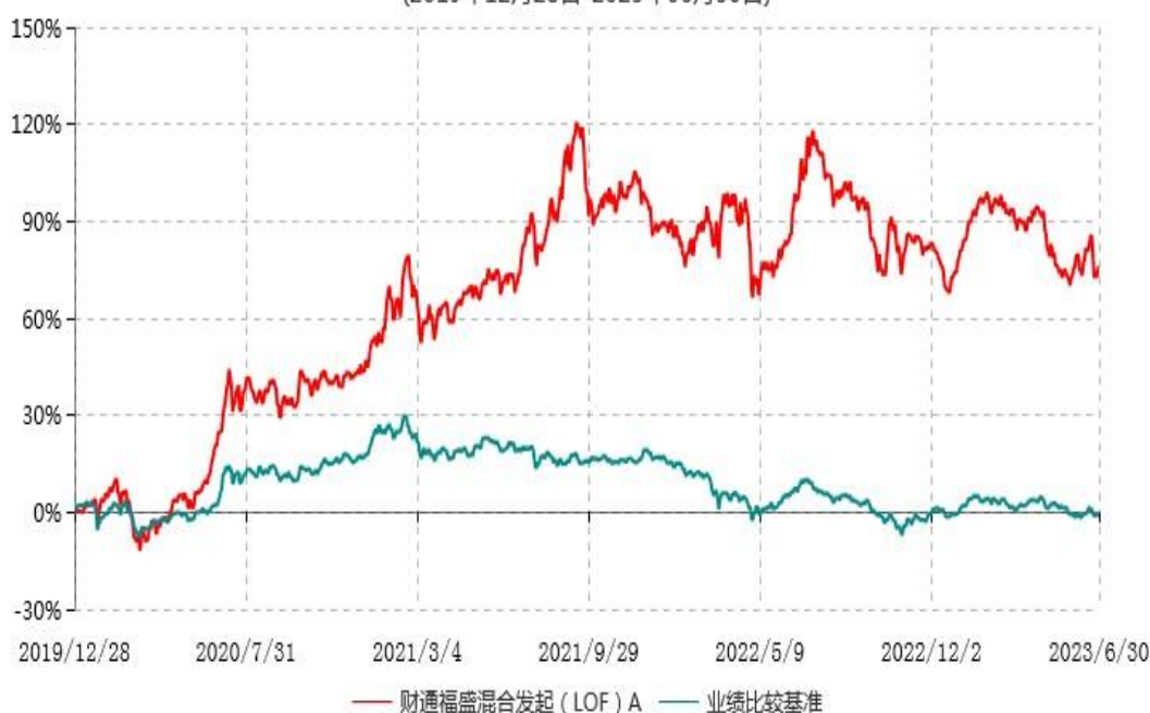
财通福盛混合发起（LOF）A累计净值增长率与业绩比较基准收益率历史走势对比图 (2019年12月28日-2023年06月30日)