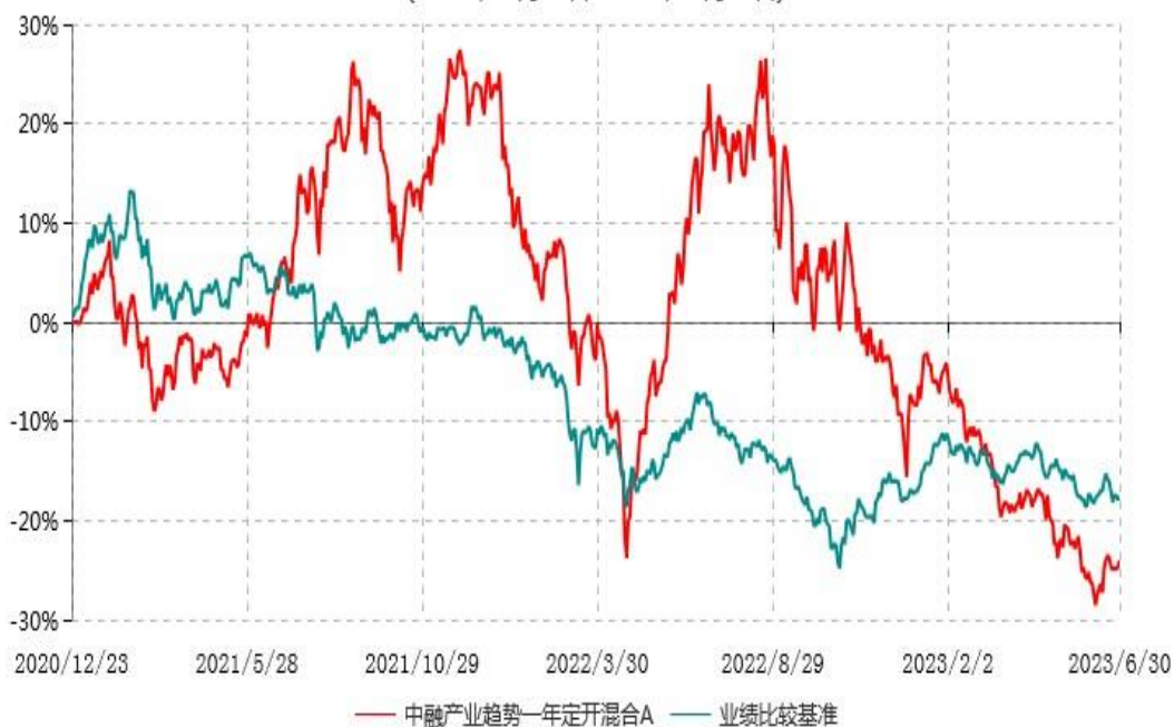
中融产业趋势一年定开混合A累计净值增长率与业绩比较基准收益率历史走势对比图 (2020年12月23日-2023年06月30日)