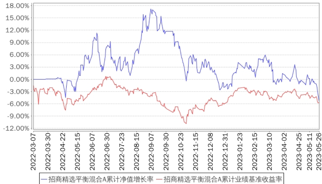
招商精选平衡混合A累计净值增长率与同期业绩比较基准收益率的历史走势对比图