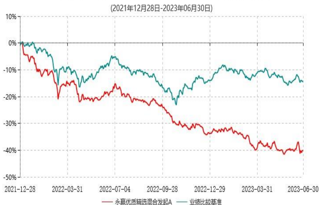
永赢优质精选混合发起A累计净值增长率与业绩比较基准收益率历史走势对比图