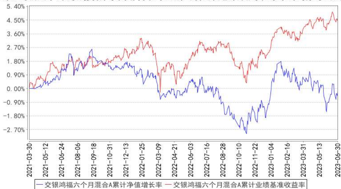
交银鸿福六个月混合A累计净值增长率与同期业绩比较基准收益率的历史走势对比图