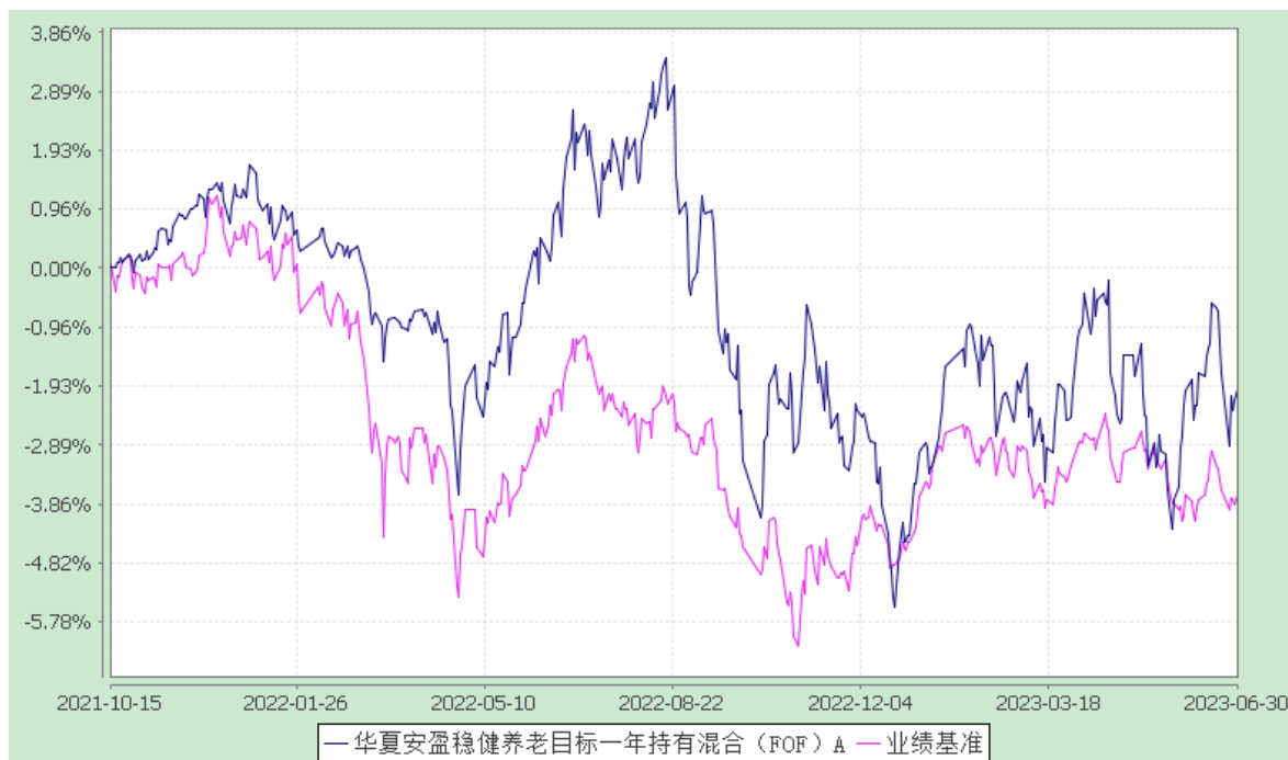
华夏安盈稳健养老目标一年持有混合（FOF）Y：