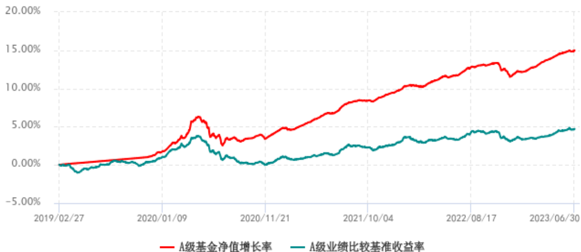
A 级基金份额累计净值增长率与同期业绩比较基准收益率历史走势对比图 (2019年02月27日-2023年06月30日)