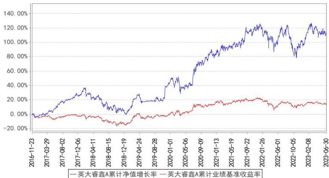
英大睿鑫A累计净值增长率与同期业绩比较基准收益率的历史走势对比图