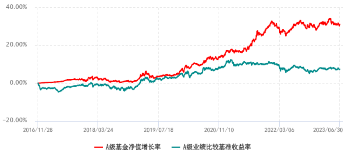
A 级基金份额累计净值增长率与同期业绩比较基准收益率历史走势对比图 (2016年11月28日-2023年06月30日)