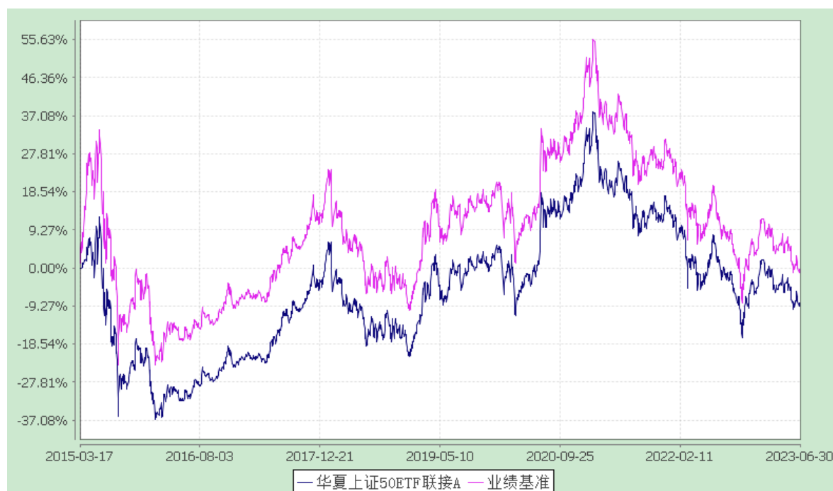
华夏上证 50ETF 联接 C: