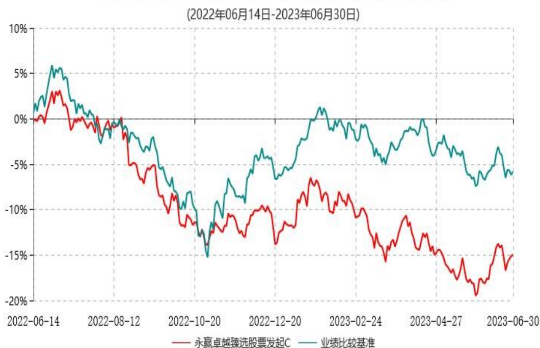
永赢卓越臻选股票发起C累计净值增长率与业绩比较基准收益率历史走势对比图