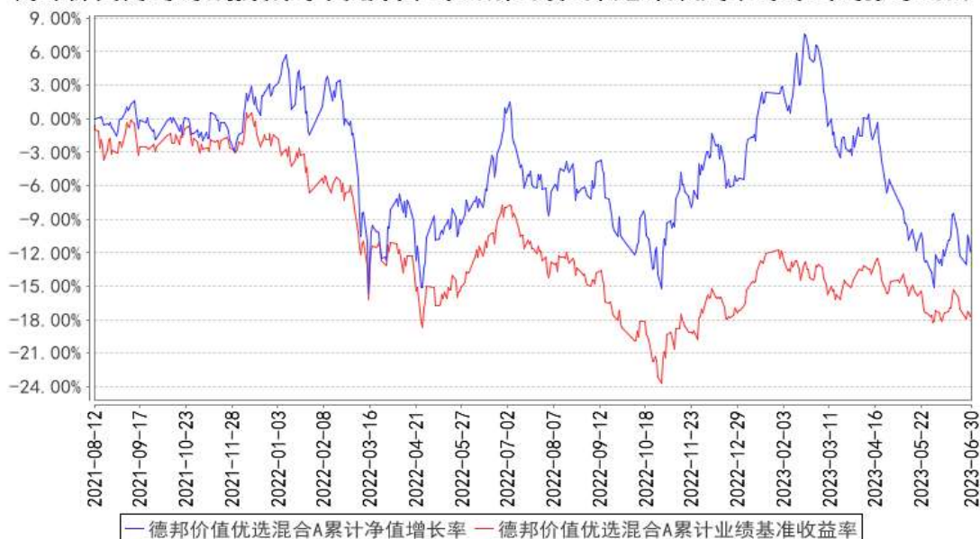
德邦价值优选混合A累计净值增长率与同期业绩比较基准收益率的历史走势对比图