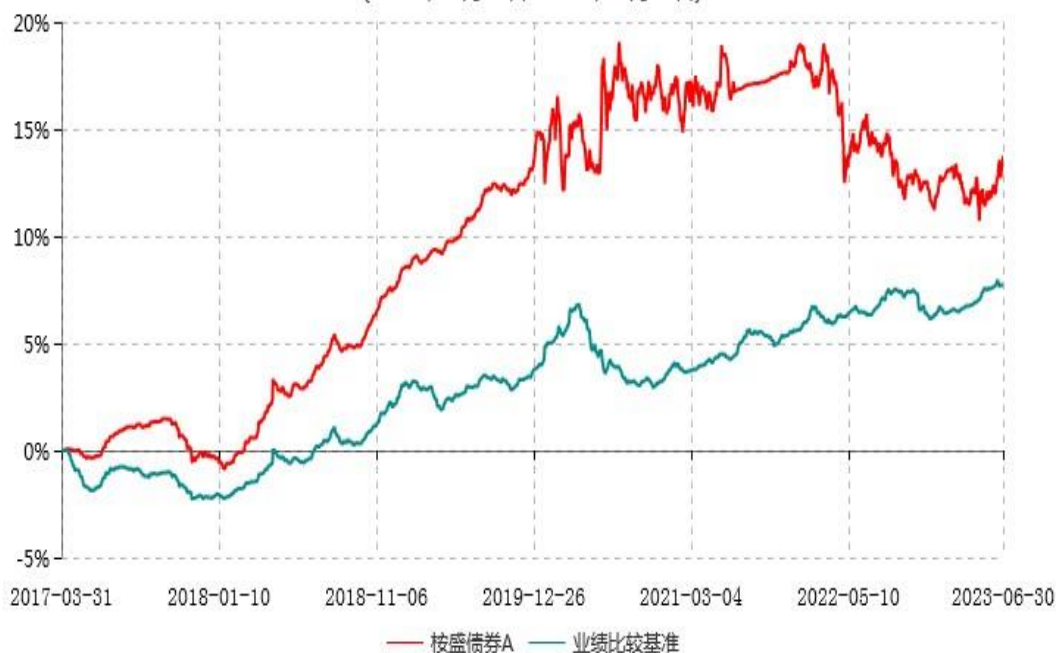
桉盛债券C累计净值增长率与业绩比较基准收益率历史走势对比图