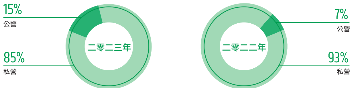
截止年度公營界別及私營界別模板工程項目的百分比

本集團於截至二零二三年三月三十一日止年度主要從事私人住宅及商業大廈建築工程的模板搭建工程。近年來，為將範圍分散至不同類型的建築項目，本集團亦已承接公營房屋建築工程的模板工程。由此可見，我們承接的建造項目包括公營界別項目（包括以政府部門及法定機構為最終僱主的項目）及私營界別項目（包括以地產發展商及土地擁有人為最終僱主的項目）。截至二零二三年三月三十一日止年度，私營界別項目所得收益為約405,461,000港元（二零二二年：約558,254,000港元），佔本集團總收益的約85.4%（二零二二年：約92.9%），而約69,307,000港元（二零二二年：約42,609,000港元），佔本集團總收益約14.6%（二零二二年：約7.1%）乃來自我們承接的公營界別項目。