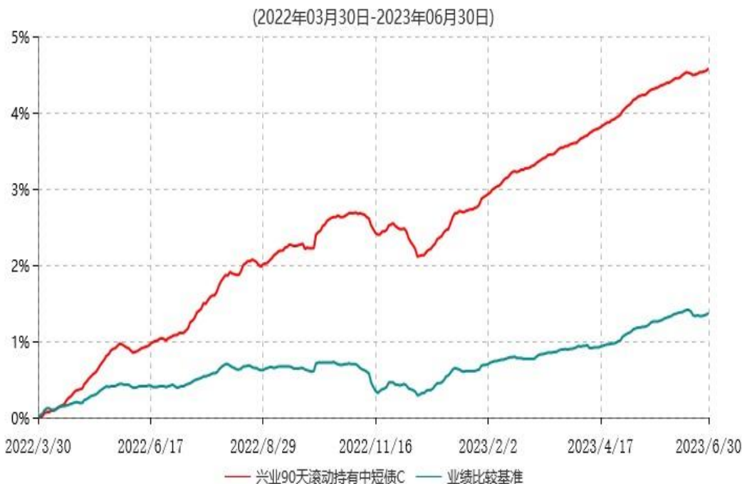
兴业90天滚动持有中短债C累计净值增长率与业绩比较基准收益率历史走势对比图

注：本基金基金合同于 2022 年 03 月 30 日生效，根据本基金基金合同规定，本基金自基金合同生效之日起六个月内已使基金的投资组合比例符合基金合同的约定。