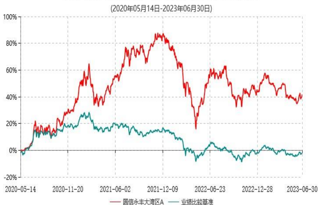
圆信永丰大湾区A累计净值增长率与业绩比较基准收益率历史走势对比图