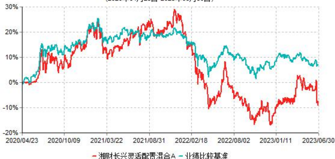
湘财长兴灵活配置混合A累计净值增长率与业绩比较基准收益率历史走势对比图 (2020年04月23日-2023年06月30日)