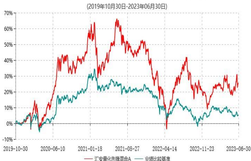
汇安量化先锋混合A累计净值增长率与业绩比较基准收益率历史走势对比图