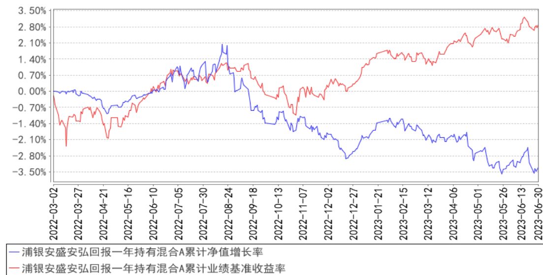
浦银安盛安弘回报一年持有混合A累计净值增长率与同期业绩比较基准收益率的历史走势对比图