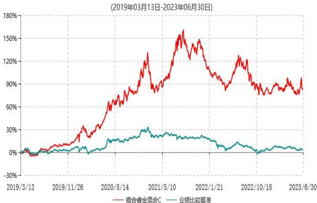
嘉合睿金混合C累计净值增长率与业绩比较基准收益率历史走势对比图

注：1、本基金于 2019 年 3 月 13 日由“嘉合睿金定期开放灵活配置混合型发起式证券投资基金”转型而来。