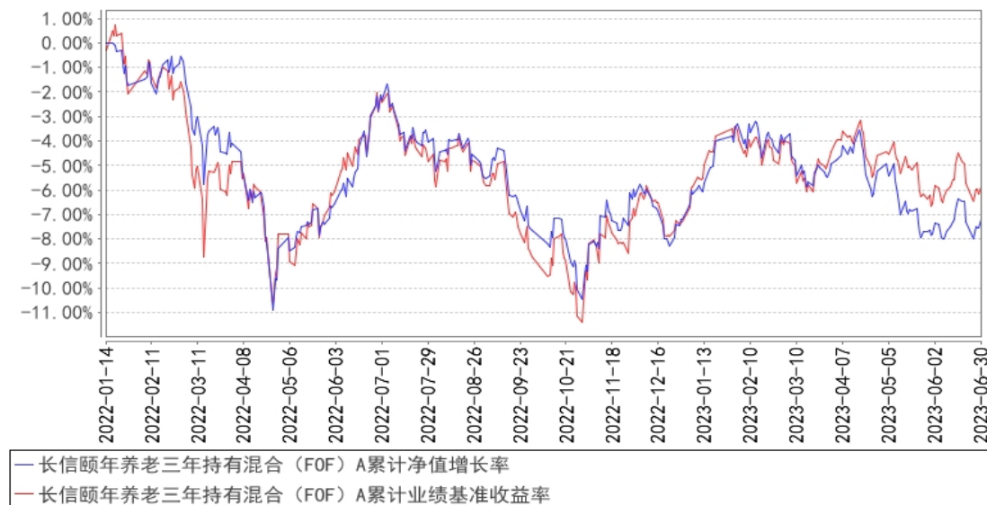
长信颐年养老三年持有混合（FOF）A 累计净值增长率与同期业绩比较基准收益率的历史走势对比图