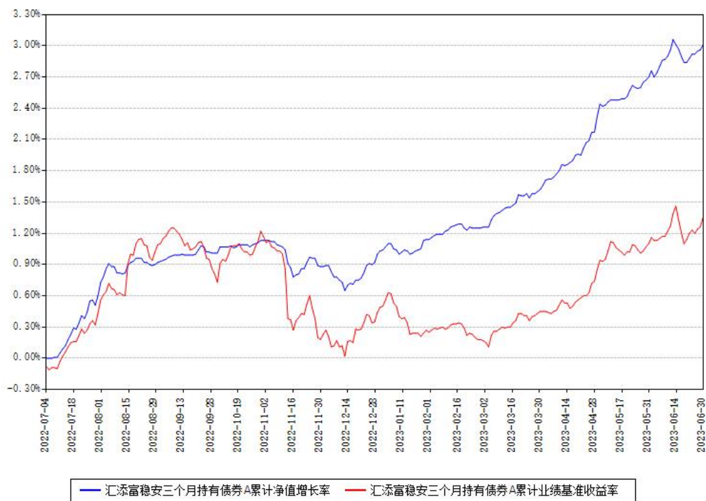
汇添富稳安三个月持有债券A累计净值增长率与同期业绩基准收益率对比图