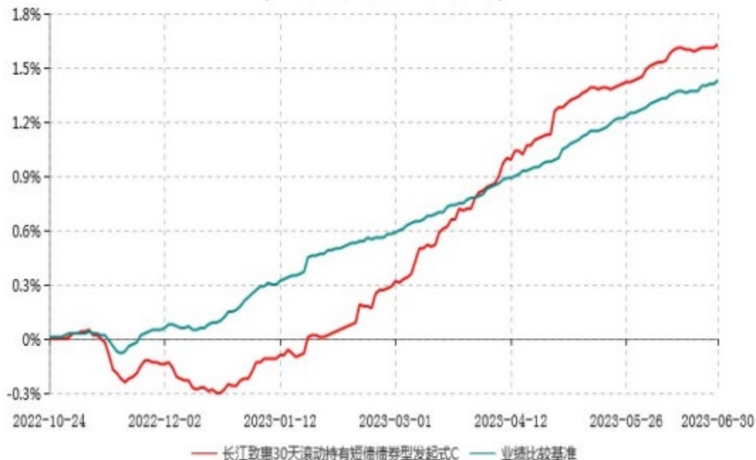
长江致惠30天滚动持有短债债券型发起式C累计净值增长率与业绩比较基准收益率历史走势对比图 (2022年10月24日-2023年06月30日)

注：本基金 C 类份额“自基金合同生效以来”的报告期为 2022 年 10 月 24 日至 2023 年 6 月 30 日。