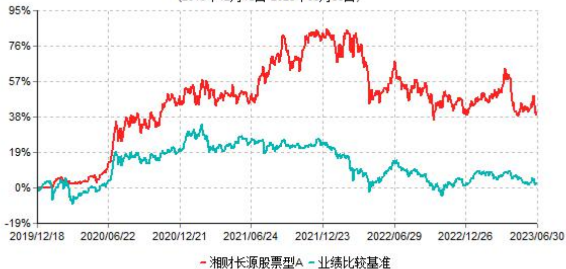
湘财长源股票型A累计净值增长率与业绩比较基准收益率历史走势对比图 (2019年12月18日-2023年06月30日)