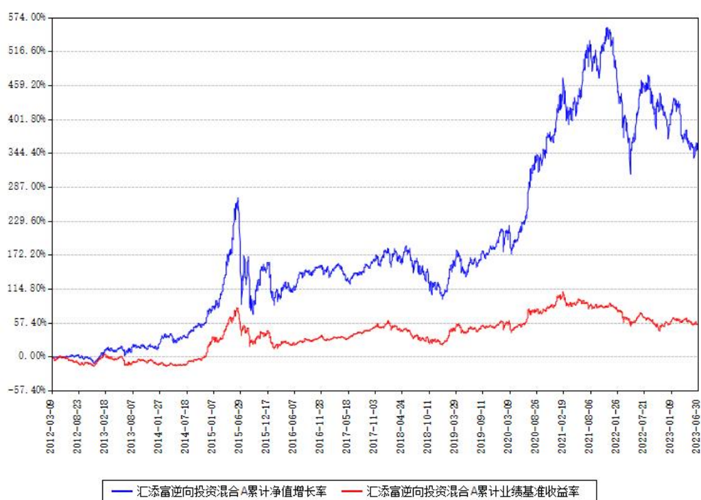
汇添富逆向投资混合A累计净值增长率与同期业绩基准收益率对比图